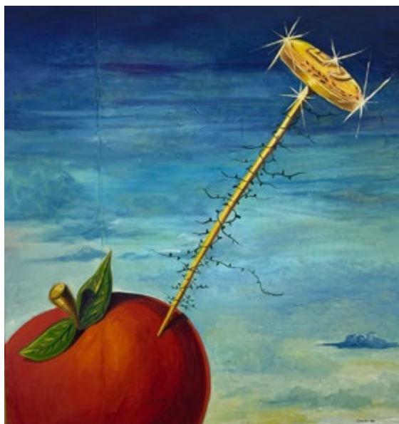
喬治·康多, International Food Money , 1984, 油畫布本, 200 x 200cm

在本次展覽中，六位藝術家在其藝術道路的不同階段創作了超現實主義作品。國際知名藝術家喬治·康多 (George Condo) 的早期創作靈感來自超現實主義大師雷內·馬格里特，早期作品反映了超現實主義的影響。中國藝術家劉宏偉的作品充滿細緻的刻劃，以兒童為主題，作品喚起了藝術家的童年記憶、文化背景和超現實的想像。日本藝術家田上允克的油畫作品刻劃了比例誇大的巨人和微小動物，背景為綠色的戶外環境，細看體現了藝術家對人與動物和大自然關係的反思。張弓的早期作品揉合超現實感和普普藝術的具像，豐富的結構、內容和細節帶有不同的角度和層次，比喻性的符號穿梭在畫面中，讓人解讀和聯想到畫意。恩杰·加拉 (Enej Gala) 的畫面結構以抽象的棕啡調為主，題目是發人深省的作品標題。加拉以超寫實的抽象畫，引發觀者對身份的認識，並展示一些與身份的存在相關的神話，邀請觀者去思考和想像。阿涅塞·蓋多 (Agnese Guido) 一直對超現實主義藝術著迷。她的作品異想天開，充滿黑色幽默和反思，滲透了弦外之音。