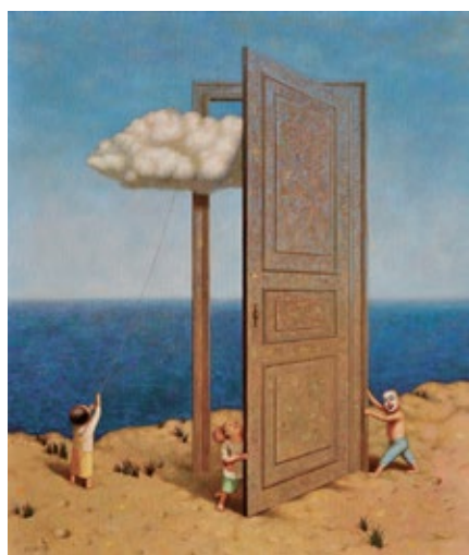
LIU HONG WEI, Cloud Behind the Door , 2014, Oil on canvas, 100 x 85 cm