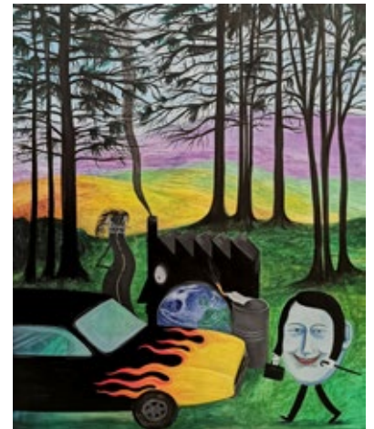
阿涅塞·蓋多，塑膠人之旗幟，2019， 油畫木本，50 x 60 cm

阿涅塞·蓋多 (Agnese Guido) 1982 年出生於意大利萊切，在米蘭生活和作品。她畢業於布雷拉美術學院。在蓋多的繪畫世界中，異想天開的怪誕世界既是對我們周圍現實世界的一種逃避，也是一種產物。它由一群擬人化的角色組成，他們為流行文化偶像、舊技術硬件和日常用品注入了活力。這些人物體現了焦慮、孤獨和幻覺以及當代生活的其他投射。「我想我是一個超現實主義者。我絕對有雙關語的傾向，徘徊在無意識中，玩弄想法和事物之間隱藏的聯繫。在我的想像中有反復出現的元素，比如摩天大樓或城市建築、冒煙的工廠、街道、香煙和各種物體，人類很少，有時甚至不存在，更多的是根據他們所代表的而不是根據他們是什麼來表現的。」講故事對蓋多來說很重要。蓋多的畫作揭示了我們對事物、我們的聲音和我們最不受控制的本能的依戀，但帶有一種輕諷刺的意味，令人會心一笑。