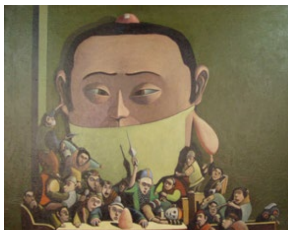
TAGAMI MASAKATSU, Untitled