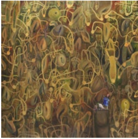
恩杰·加拉， Monument to those who taught us everything, almost everything, 2015, 油画布本，209 x 209cm

恩杰·加拉 (Enej Gala) 1990 年出生于斯洛文尼亚卢布尔雅那，2013 年毕业于威尼斯美术学院，主修绘画。他曾在鹿特丹的威廉德库宁美术学院留学一段时间。2015 年，他毕业于威尼斯学院的绘画专业。加拉曾在斯洛文尼亚、意大利、黑山、克罗地亚、阿尔巴尼亚、塞内加尔、荷兰和葡萄牙参加过多个群展和个展。自 2010 年以来，他参加了由 Carlo di Raco 在 Forte Marghera 策划的 Atelier F 绘画工作室。2012 年获得 Bevilacqua la Masa Foundation 基金会第 96 届青年艺术家集体奖学金。2015 年，他获得了与艺术同行——Stonefly Art Prize