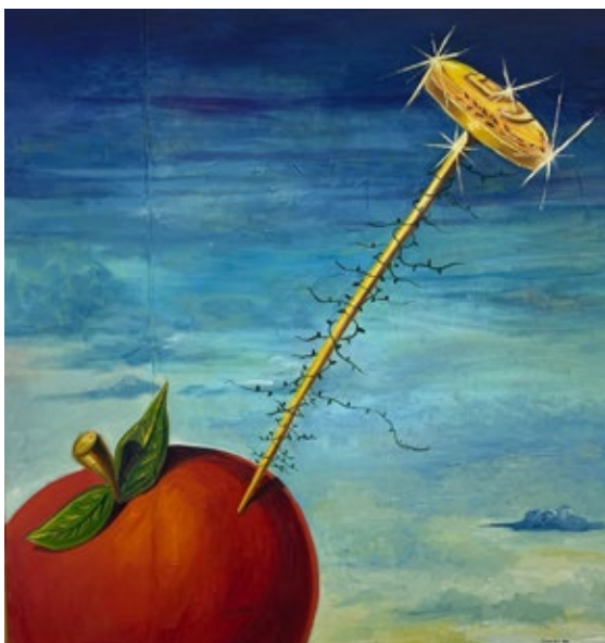
George Condo, International Food Money , 1984, Oil on canvas, 200 x 200cm