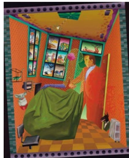
ZHANG GONG, The Elements of Love , 1993, Oil on canvas, 100 x 80.3cm

His works are in the Public Collection of M+ Museum, Hong Kong, Asia Society Contemporary Art Collection, New York Burger Collection, Berlin and The Saatchi Collection, London.